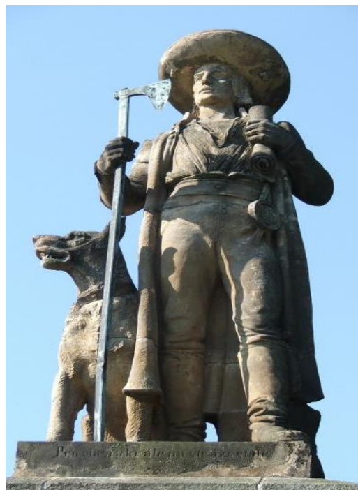
Chod – strážce zemské hranice

TRASY 5 - 18 km v několika variantách dle zdatnosti účastníků, m.j. navštívíme: Domažlice – Babylon – Čerchov – Česká Kubice – Rýzmberek – Koráb – Kdyně – Haltrava – Starý Herštejn – Pivoň – Horšovský Týn – Capartice – Hrádek – Újezd – Čertův kámen – Schönsee – Böhmerwaldturm – Pleš – Klenčí pod Čerchovem