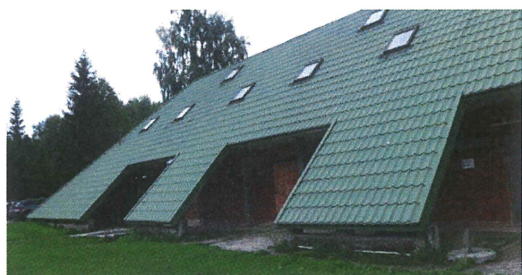
Ubytovna – Pavilon A (v patře)