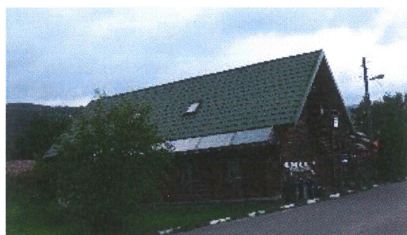
Ubytovna – Pavilon B (v patře)